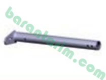
Şanzıman Ana Boru