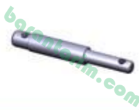
Traktör Bağlantı Pimi