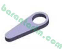
Şanzıman Civata Kontrol Lamalı Somun