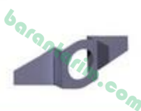
Şaft Plastik Bağlantı Sacı