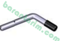
12 mm Kilit Pimi