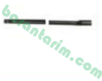
Uzun Şaft Milii