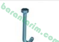
Kancalı Yay Civatası