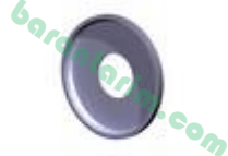
Teker Toz Kapağı