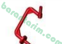
Sol Teker Akis