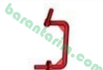
Sağ Teker Akis