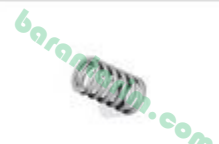
Küçük Kilit Yayı