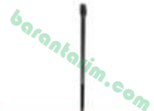
Şanzıman Uzun Civata