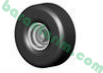
Teker Ve Jant